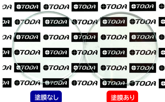
【塗布後のガラス外観】